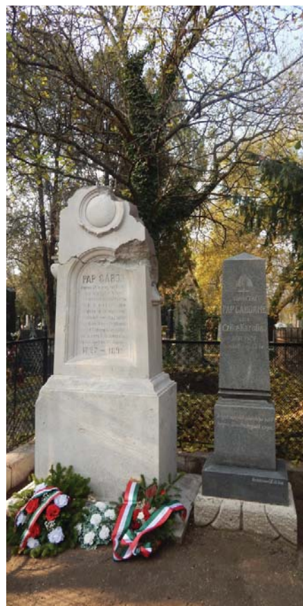
Pap Gábor felújított sírköve

lelkipásztor, kiváló hazafi távozott az élők sorából. Ahogy az egész város megmozdult a szeretett lelkész meghívása, beiktatása kapcsán, úgy az utolsó útjára is elkísérte őt a város lakossága. Temetésén a Komáromi Zsidó Hitközség testületileg vett részt, amint arra a közgyűlési jegyzőkönyvben található – 1895. november 3-i határozat is utal. A templomi gyászünnepély és a temetési menet zavartalanlását a komáromi szekeresgazdák bandériuma biztosította. A város énekkarai gyászenéket énekelve kísérték a menetet. Síremlékét a komáromi gyülekezet állíttatta fel, mely 1945. januárjában a város bombázásakor megsérült, és 2015 októberében a komáromi református gyülekezet felújíttatta.